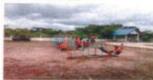
ประชาสัมพันธ์ อบต. หนองหอย